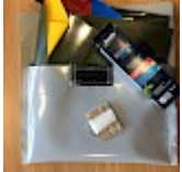
Kit REPARATIONS Structures Gonflables d ASG34