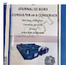
DOSSIER de Conformités & NOTICE d'Utilisation