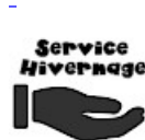
SERVICE ASG Hivernage Maintenance SAV