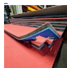
DALLE TAPIS de RÉCEPTION CLIPSABLE 2.1