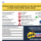
AFFICHAGE de SECURITE en 3 langues