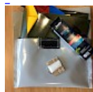
Kit REPARATIONS Structures Gonflables d ASG34