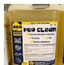
PRO CLEAN Nettoyant Spécial PVC