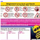
Panneau de SECURITE