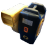
SOUFFLERIE/BLOWER Normes CE - 220v/16a - IP44 (nombre et puissance adaptée au jeu)