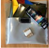
Kit REPARATIONS Structures Gonflables d'ASG34