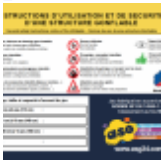
Panneau de SECURITE en 3 langues