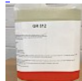
Nettoyant Structure Gonflable GR512