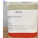
Nettoyant Structure Gonflable GR512