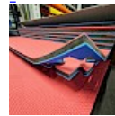
DALLE TAPIS de RÉCEPTION CLIPSABLE 2.1