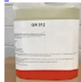
Nettoyant Structure Gonflable GR512