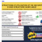
AFFICHAGE de SECURITE en 3 langues