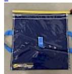
SAC de LEST Pour Structure Gonflable NEW!