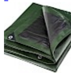
BACHE DE PROTECTION 5x8m pour Structure Gonflable 240g/m 2