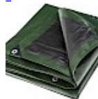
BACHE DE PROTECTION 5x8m pour Structure Gonflable 240g/m 2