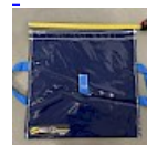
SAC de LEST Pour Structure Gonflable NEW!