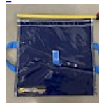
SAC de LEST Pour Structure Gonflable NEW!