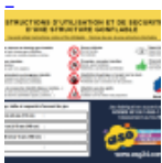
AFFICHAGE de SECURITE en 3 langues