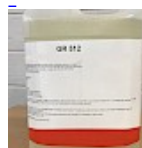
Nettoyant Structure Gonflable GR512