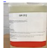
Nettoyant Structure Gonflable GR512