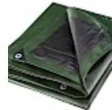
BACHE DE PROTECTION 5x8m pour Structure Gonflable 240g/m²