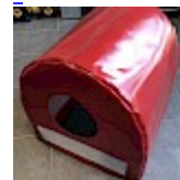
CAISSON de Protection SOUPLE pour soufflerie