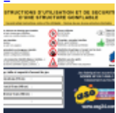
AFFICHAGE de SECURITE en 3 langues