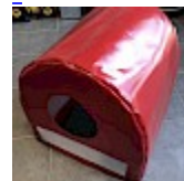
CAISSON de Protection SOUPLE pour soufflerie