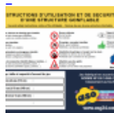
AFFICHAGE de SECURITE en 3 langues