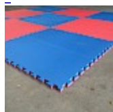
DALLE de RÉCEPTION CLIPSABLE 2.6