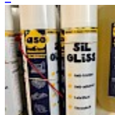
Lubrifiant Bombe pour la Glisse