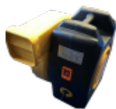
SOUFFLERIE/BLOWER Normes CE - 220v/16a - IP44 (nombre et puissance adaptée au jeu)