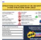
AFFICHAGE de SECURITE en 3 langues