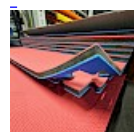
DALLE TAPIS de RÉCEPTION CLIPSABLE 2.1