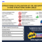
AFFICHAGE de SECURITE en 3 langues