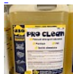
PRO CLEAN Nettoyant Spécial PVC