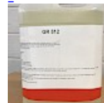
Nettoyant Structure Gonflable GR512