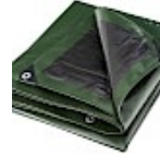
BACHE DE PROTECTION 5x8m pour Structure Gonflable 240g/m 2