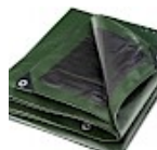
BACHE DE PROTECTION Pour Structure Gonflable 5x8 240g/m²