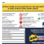
AFFICHAGE de SECURITE en 3 langues