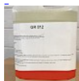
Nettoyant Structure Gonflable GR512