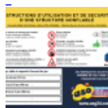
AFFICHAGE de SECURITE en 3 langues