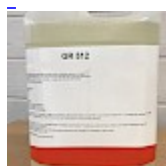
Nettoyant Structure Gonflable GR512