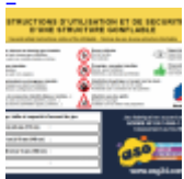
Panneau de SECURITE en 3 langues