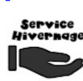
SERVICE ASG Hivernage Maintenance SAV