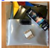
Kit REPARATIONS Structures Gonflables d ASG34