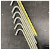
Crosses, Piquets d'ANCRAGE 42 cm