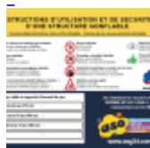
AFFICHAGE de SECURITE en 3 langues