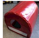
CAISSON de Protection SOUPLE pour soufflerie