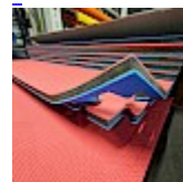
DALLE TAPIS de RÉCEPTION CLIPSABLE 2.1