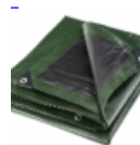
BACHE DE PROTECTION Pour Structure Gonflable 5/8/240grm 2