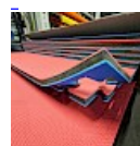
DALLE TAPIS de RÉCEPTION CLIPSABLE 2.1