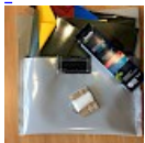
Kit REPARATIONS Structures Gonflables d ASG34