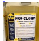
PRO CLEAN Nettoyant Spécial PVC