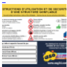
Panneau de SECURITE en 3 langues