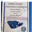
DOSSIER de Conformités & NOTICE d'Utilisation