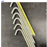
Crosses, Piquets d'ANCORAGE 42 cm