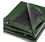
BACHE DE PROTECTION 5x8m pour Structure Gonflable 240g/m 2