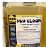
PRO CLEAN Nettoyant Spécial PVC