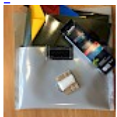
Kit REPARATIONS Structures Gonflables d ASG34