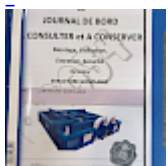
DOSSIER de Conformités & NOTICE d'Utilisation