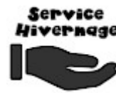
SERVICE ASG Hivernage Maintenance SAV