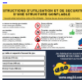
Panneau de SECURITE en 3 langues