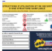
Panneau de SECURITE en 3 langues