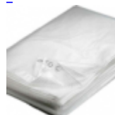
BACHE DE PROTECTION Pour Structure Gonflable 4/6/300grm 2