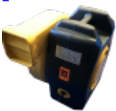
SOUFFLERIE/BLOWER Normes CE - 220v/16a - IP44 (nombre et puissance adaptée au jeu)