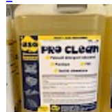
PRO CLEAN Nettoyant Spécial PVC