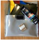
Kit REPARATIONS Structures Gonflables d ASG34