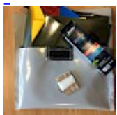
Kit REPARATIONS Structures Gonflables d'ASG34