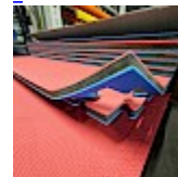
DALLE TAPIS de RÉCEPTION CLIPSABLE 2.1