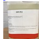
Nettoyant Structure Gonflable GR512