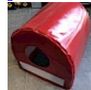
CAISSON de Protection SOUPLE pour soufflerie