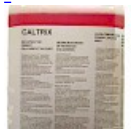
Anti calcaire Structure Gonflable CALTRIX