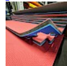
DALLE TAPIS de RÉCEPTION CLIPSABLE 2.1