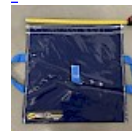
SAC de LEST Pour Structure Gonflable NEW!