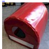
CAISSON de Protection SOUPLE pour soufflerie