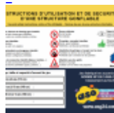
AFFICHAGE de SECURITE en 3 langues