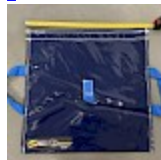
SAC de LEST Pour Structure Gonflable NEW!