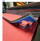
DALLE TAPIS de RÉCEPTION CLIPSABLE 2.1