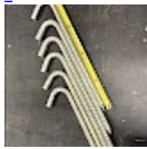
Crosses, Piquets d'ANCAGE 42 cm