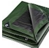
BACHE DE PROTECTION 5x8m pour Structure Gonflable 240g/m²