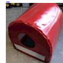
CAISSON de Protection SOUPLE pour soufflerie