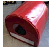
CAISSON de Protection SOUPLE pour soufflerie