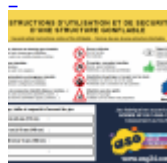
AFFICHAGE de SECURITE en 3 langues