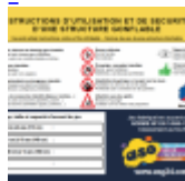
AFFICHAGE de SECURITE en 3 langues