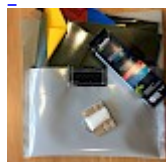
Kit REPARATIONS Structures Gonflables d' ASG34