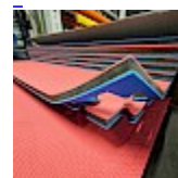
DALLE TAPIS de RÉCEPTION CLIPSABLE 2.1