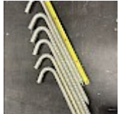
Crosses, Piquets d'ANCAGE 42 cm