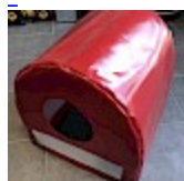
CAISSON de Protection SOUPLE pour soufflerie