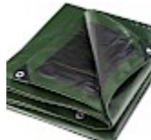
BACHE DE PROTECTION 4x5m pour Structure Gonflable 240 g/m 2