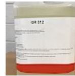
Nettoyant Structure Gonflable GR512