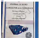
DOSSIER de Conformités & NOTICE d'utilisation