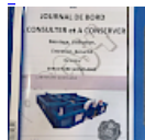
DOSSIER de Conformités & NOTICE d'Utilisation